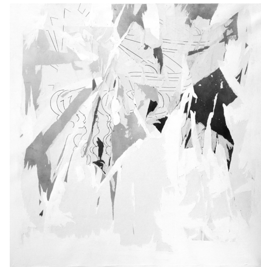
Szentesi Csaba: Cím nélkül / Untitled , 2016

Csaba Szentesi's (1977) newest series of works exhibited in Trafó is built upon gestures of paper-tearing, which create instinctive abstract forms. The motifs of Szentesi's collages and montages are outspokenly inspired by applied graphic design trends as the artist bursts the logos, emblems and visual entities of brands. The punkish works of Szentesi can be more easily approached from the direction of the personal experience of anger of destruction, than the more analytical deconstruction. Szentesi paints his geometric, non-figurative motifs on papers, which he applies with paint or pen to the canvas, which then he systematically tears down from the surface. The smaller series of the artist is based rather on the gesture of folding than destruction. His small paper objects are colorful, minimalistic pieces of art with oversaturated colors and spiky geometry.