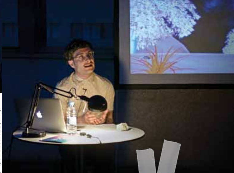
Serafin Álvarez: The Belly of the Whale, 2014