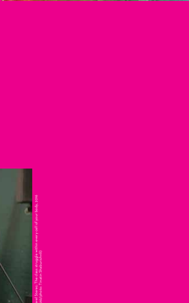
Ralo Mayer: E.T.E. – Extra-Terrestrial Ecologies, 2016. Digitális kollázs / digital collage