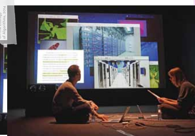
Pakui Hardware: For Subjects with Perfect Knees