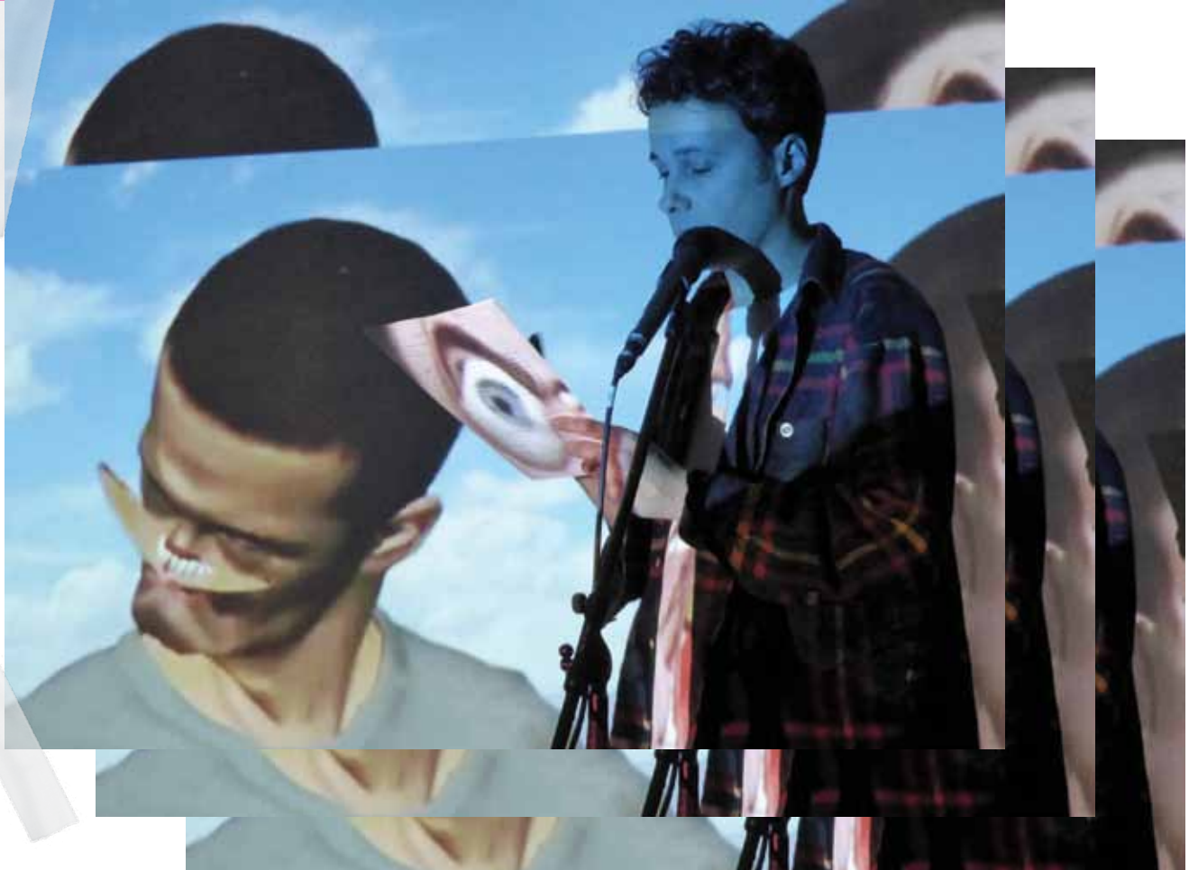
Pedro Barateiro: The Sad Savages, 2014