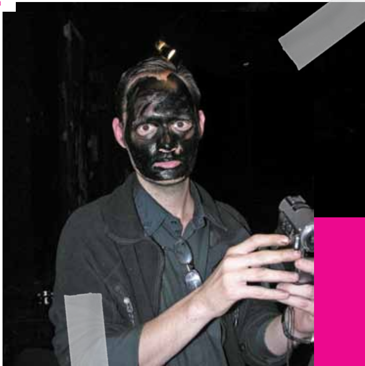
Kis Varsó: A Little Warsaw, 2016. Művészeti kiállítás / Production still