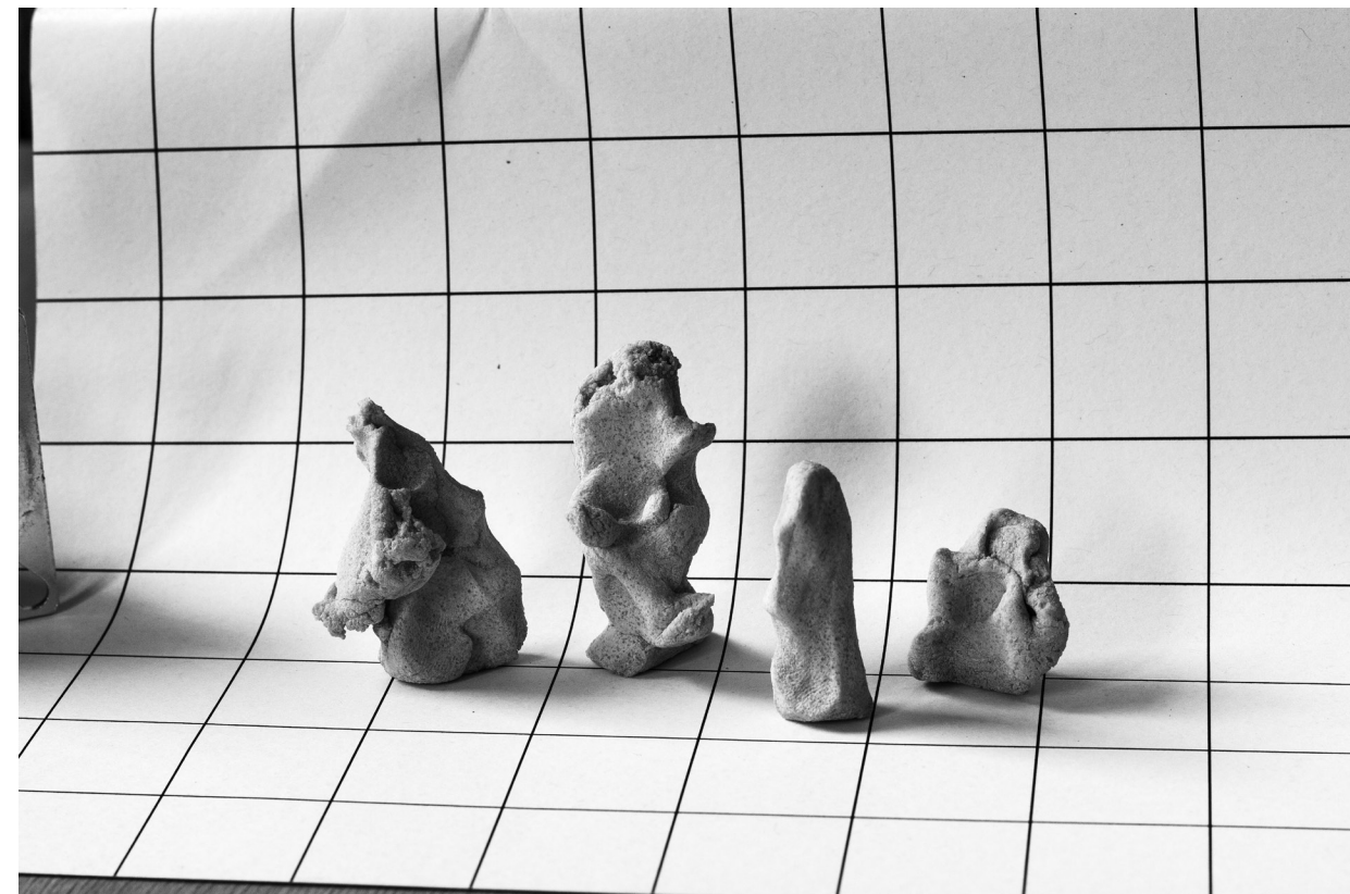
M., P., F. és L., F. által / M., P., F. and L. by F., 2016.

Puklus was a participant of many artist-in-residence programs from Residency Unlimited, New York to Banska Stiavnica St a nica Contemporary. His most recent and still on-going project entitled The Hero Mother - How to build a house received Grand Prix Images Vevey, in 2013. He was a FOAM Talent of Fotomuseum Amsterdam. His photobooks got nominated for different awards like the Aperture / Paris Photo Photobook Award or the German Photo Book Award.